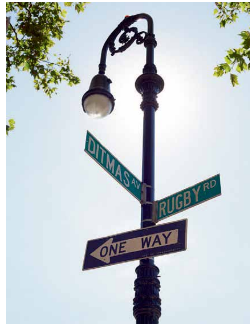
RESTAURERT BYDEL. Ditmas Park var tidligere en del av Flatbush, en belastet del av Brooklyn i New York. De senere årene har området hatt et oppsving, og hollywoodproduksjoner som den Oscar-nominerte 2005-filmen «The Squid and The Whale» er i sin helhet innspilt i gatene her.