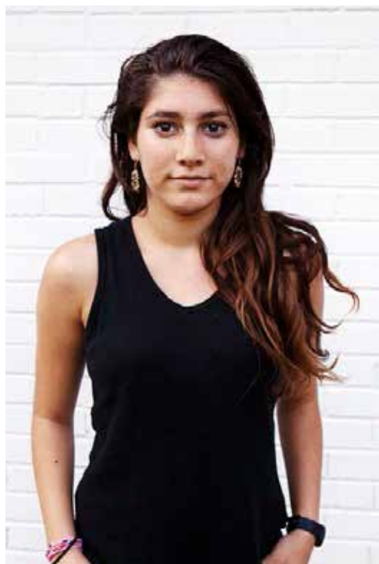
NAVN ALDER FRA