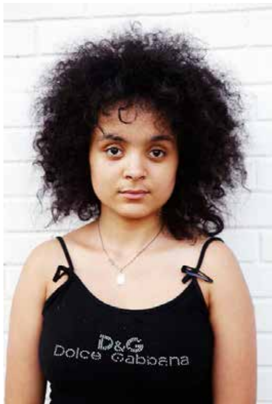
NAVN ALDER FRA