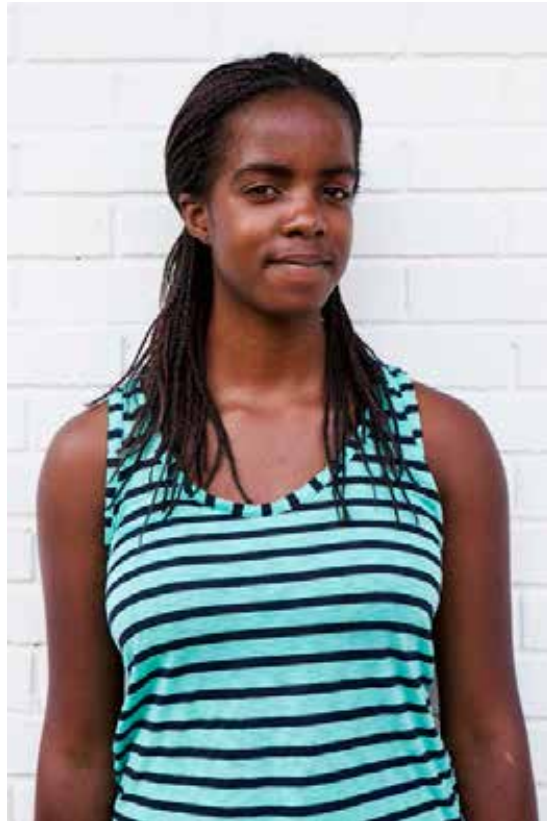
NAVN ALDER FRA