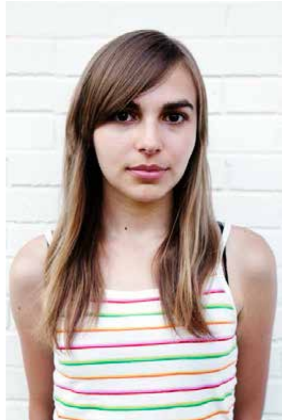
NAVN ALDER FRA