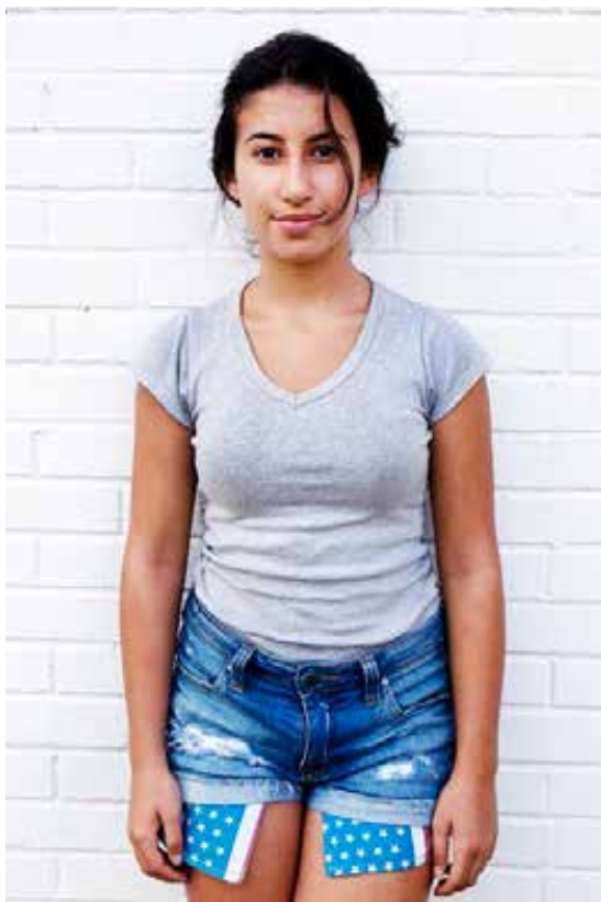
NAVN ALDER FRA