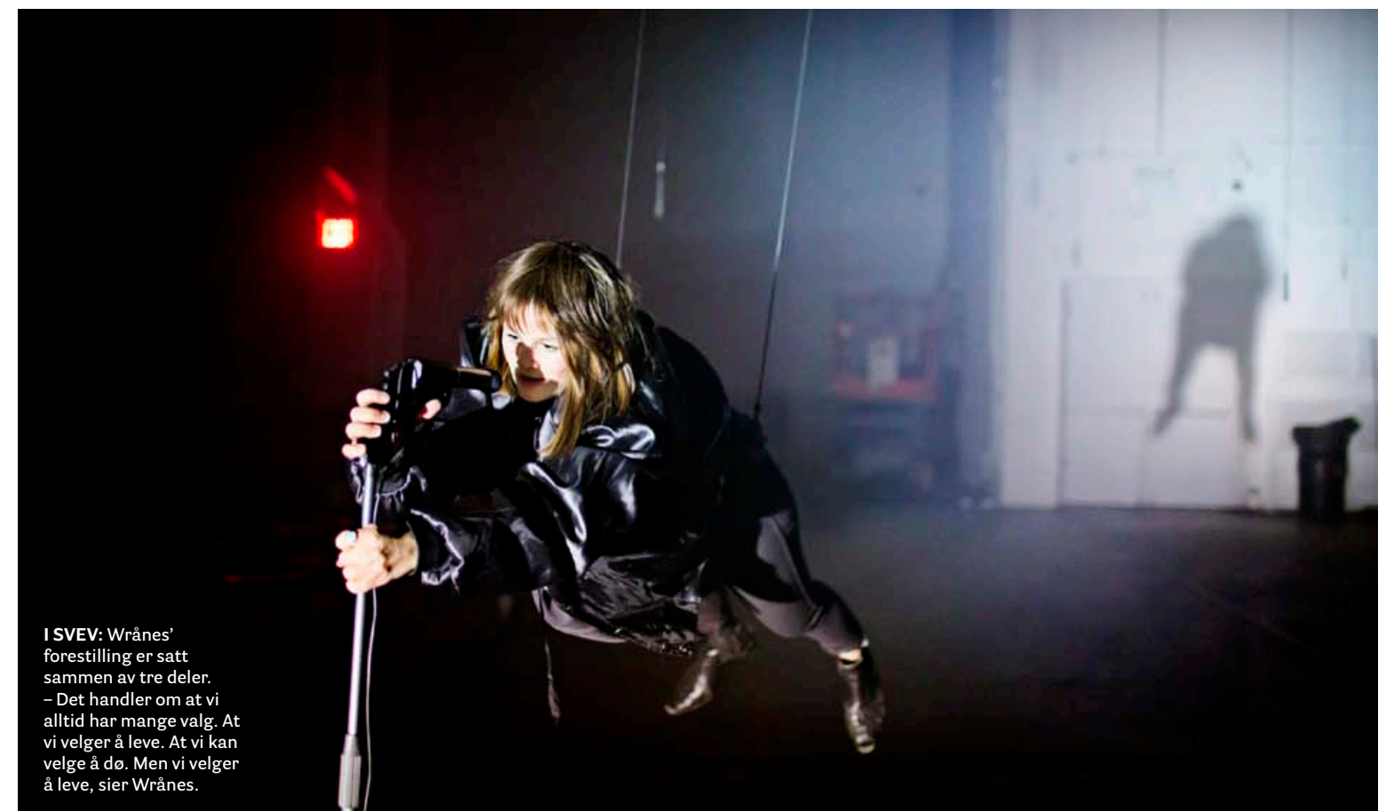
I SVEV: Wrånes' forestilling er satt sammen av tre deler. – Det handler om at vi alltid har mange valg. At vi velger å leve. At vi kan velge å dø. Men vi velger å leve, sier Wrånes.