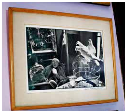
BRYLLUPSGAVE: Dette bildet av maleren Henri Matisse fikk ekteparet av fotografen Henri Cartier-Bresson da de giftet seg.