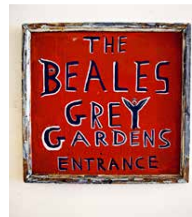
VIKTIGST: Maysles mener dokumentaren Grey Gardens , om en mor og datter, er den viktigste han har laget.