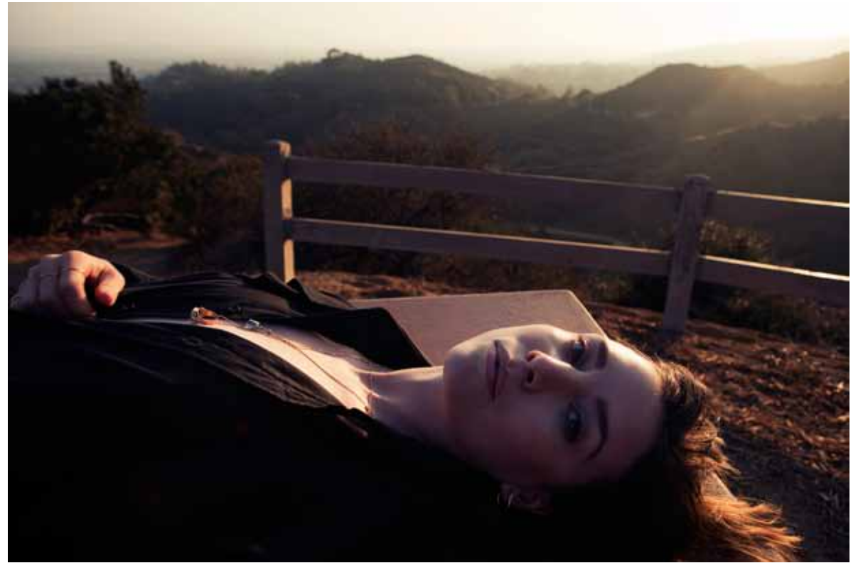
SLIK MAN ELSKER. Inspirasjon kan komme skyllende over Lykke Li når som helst, hun kjenner det daglig. Men går gjerne på tur i fjellene om morgenen når tåken fortsatt ligger lavt. For ikke lenge siden kom hun over et sitat som hun tok til seg: «Break my heart, breake it again, so I can love you even deeper». – Er det ikke fint? Man må knuse hjertet helt til det åpner. Det er