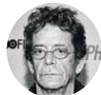
LOU REED (71) musiker og ektemann

– Laurie Anderson er den mest fascinerende personen jeg kjenner. Vakker, talentfull og uendelig kreativ. Hennes vakre stemme. Hennes skrå, kloke