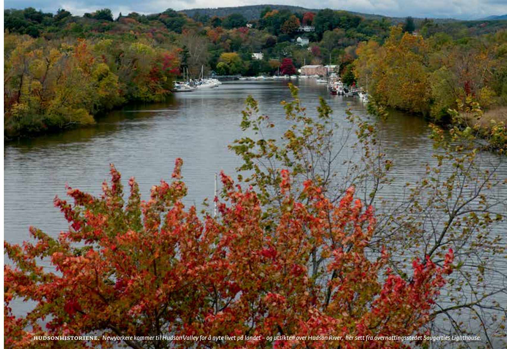
HUDSONHISTORIENE. Newyorkere kommer til Hudson Valley for å nyte livet på landet – og utsikten over Hudson River, her sett fra overnattingsstedet Saugerties Lighthouse.

TEKST LINE TILLER Hudson Valley, New York