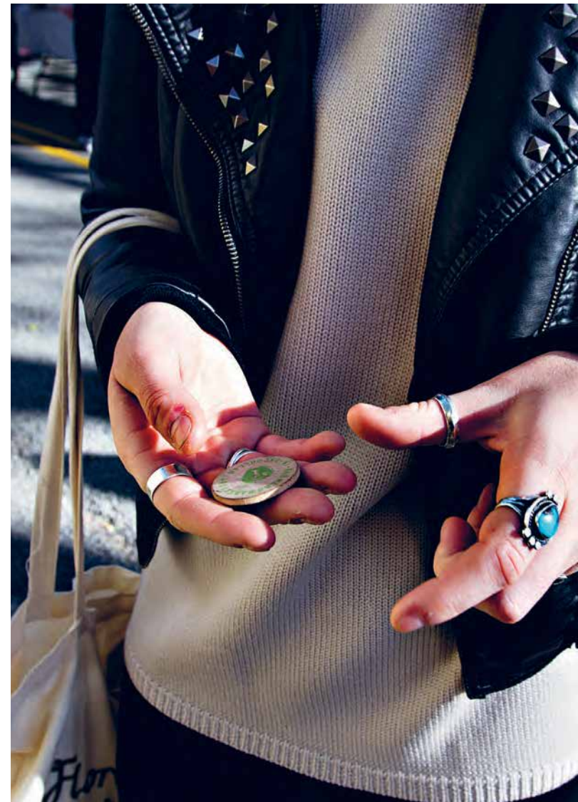
MAGER KOST. På enkelte utendørsmarked i USA kan man bytte inn en food stamp-dollar i to lekepengedollar.

Om man tjener under 84.000 kroner i året, kan man i utgangspunktet motta matkuponger – men enkelte →