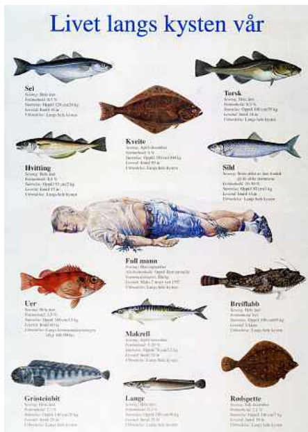
PASS PÅ: På kontoret til savnet-gruppa henger denne plakaten til skrekk og advarselt, da de fleste som forsvinner fra byen, blir funnet i vann.