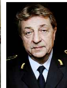
TRAVEL: — De fleste forsvinner i helga, sier Trond Skaarud i Oslo-politiet.