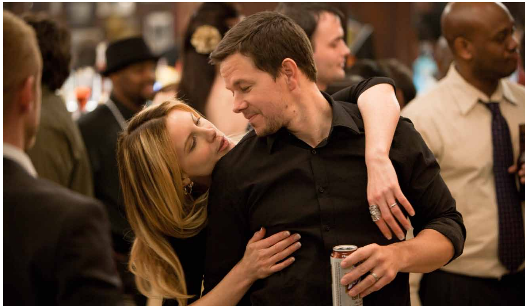
KARRIEREBYTTET. Mark Wahlberg sier han har vært i klammeri med Boston-politiet over 20 ganger. Han ble også dømt til to års ungdomsfengsel som 16-åring. I dag nyter den tidligere trøbbelmakeren respekt som både skuespiller og tv- og filmprodusent i Hollywood. Her i en scene fra kinoaktuelle «Contraband», hvor han spiller mot blant andre Kate Beckinsale.

» ett om natten, ikke kom hjem før solen sto opp og sov hele dagen. Nå liker jeg ikke New York lenger, byen er blitt for travel, for hektisk og crazy. Folk bor oppå hverandre, taxier krasjer og folk dulter inn i hverandre. – Slik var det vel før også? – Jo, men da så jeg det ikke, jeg var opptatt med å feste og ha det gøy. Men de dagene er over. Og det er jeg glad for. Det var en erfaring å ta med seg, men en gang må man jo bli voksen – selv om jeg prøvde å kjempe mot det. Jeg har kommet meg videre på grunn av hardt arbeid, en sterk tro og ved å bli moden. Å akseptere at man er blitt en gammel mann, at dagene er bak deg, at man ikke så tøff som man en gang var – det er en rar tilfredsstillelse ved det. – Du, og flere av dine søsken, havnet i fengsel i ungdomsårene. Tror du det finnes en felles grunn til det? – Ja. Shit happens. Wahlberg stryker håndflatene sammen, som før å varme opp til en boksekamp, smilet er bedragerisk, øynene direkte. – Shit happens? – Ja, ved dårlige valg, som det å begynne å bruke dop, bryte loven, stjele ting og å henge med feil folk.