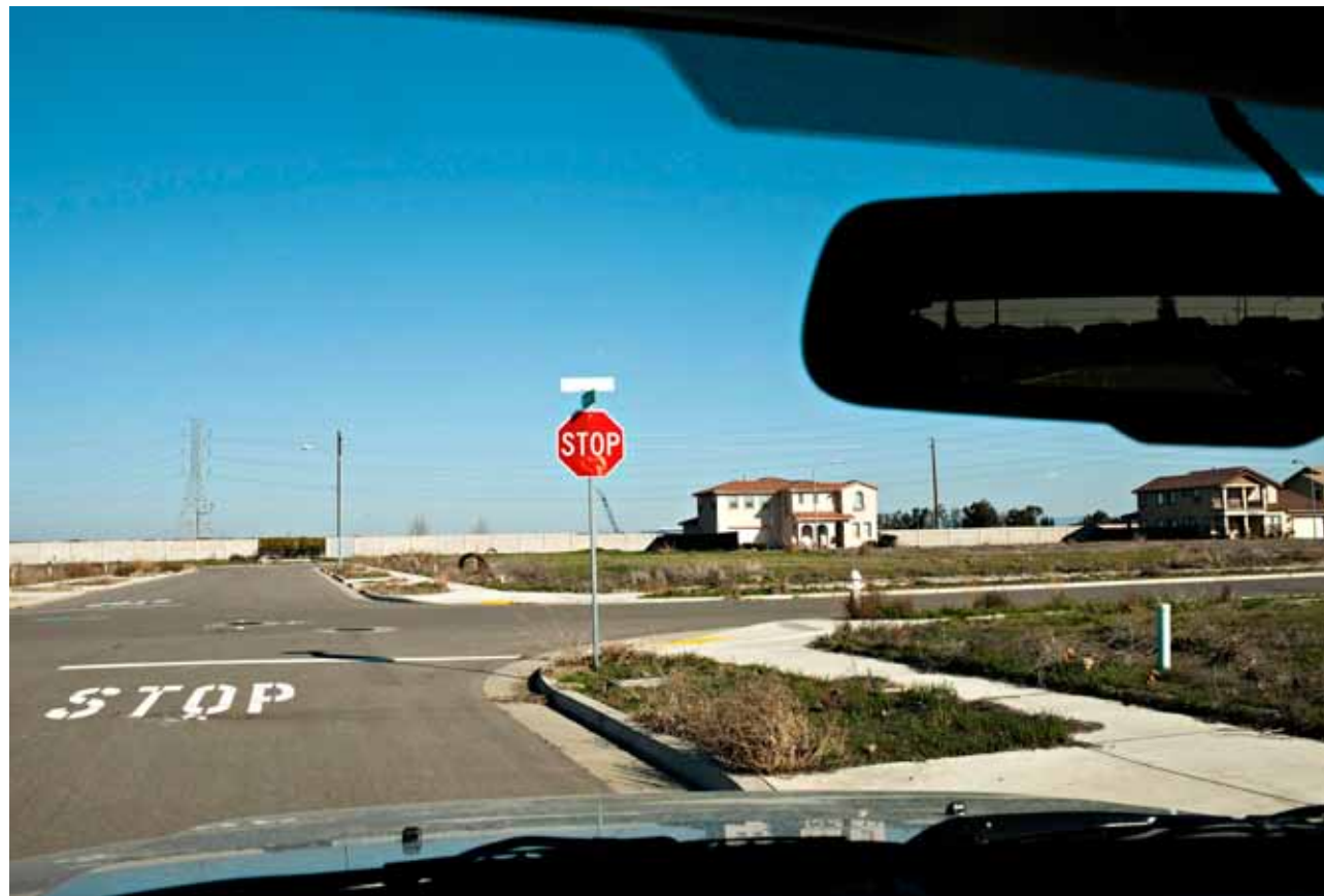
FULL STOPP. Utsikten ble ikke helt slik investorene hadde sett for seg i det uferdige eiendomsfeltet Bellevue, et steinhast unna det nye universitetet i Merced.