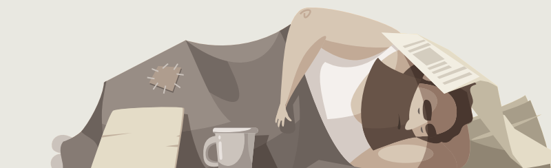
GRAFIKK: AFTENPOSTEN.

3909 personer registrert som bostedsløse i 2016. Det er en nedgang på 36 prosent fra 2012.