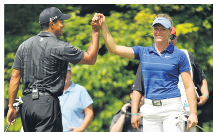
Venner og naboer. Tiger Woods og Suzann Pettersen.

– Det er viktig å være i et miljø med enere for å bli en ener selv, sier Pettersen, som for tredje gang ble kåret til Årets norske kvinnelige utøver