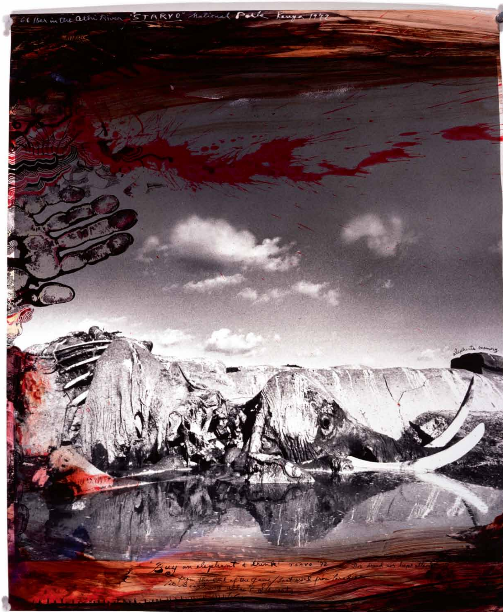
TSAVO NASJONALPARK, KENYA, 1968. Døde elefanter og blod er to sentrale arbeidsverktøy for fotografen, kontroversskaperen, playboyen og kunstneren Peter Beard. Helt siden han tok båten fra hjembyen New York og ankom Afrika på 1950-tallet har han vært oppslukt av afrikansk liv og levnad.