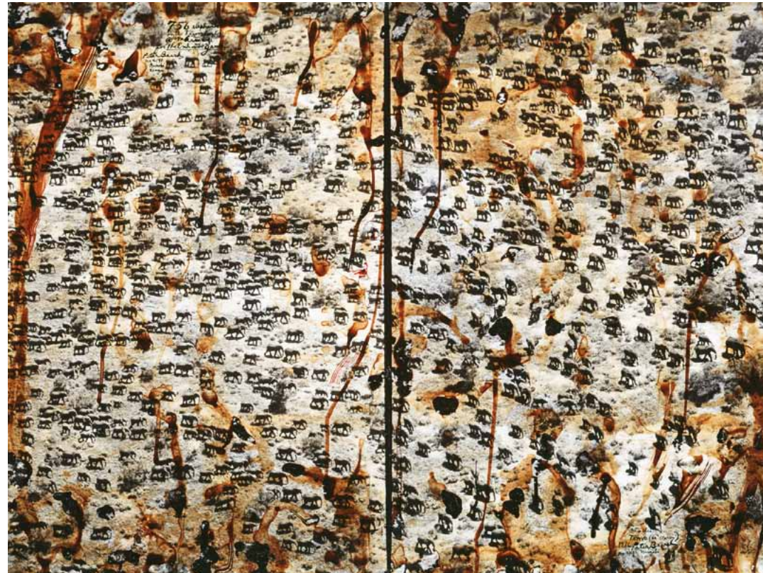
TSAVO NASJONALPARK, KENYA, 1972. Peter Beard ble utvist fra Tsavo National Park på begynnelsen av 1960-tallet fordi han ville dokumentere elefantenes massedød og mangel på mat. Da leide Beard private piloter og fløy etter elefantflokkene. Elefantbildene er fra boken «The End of the Game».