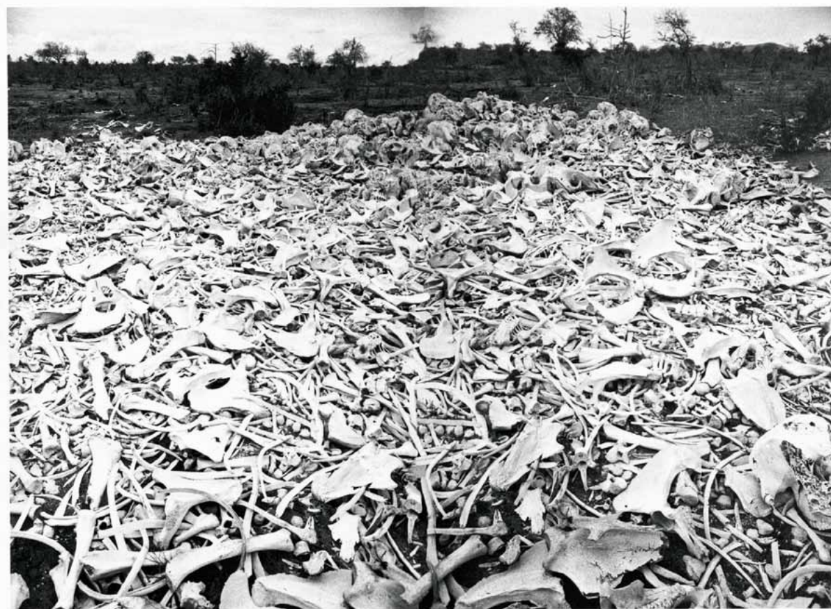
SALA GATE, GALANA, KENYA, 1976. – Elefantene lider også av stress og hjertesykdommer. Elefantmetaforen er endelig blitt tydelig. Nå kan folk se hva som skjer. Og menneskene er de neste som får svi. Tenk på det, sier Beard.

» kanskje naivt ærlige, svar, men det er ikke alltid han har dem, spesielt ikke når det gjelder hva hans egen kunst handler om – han vil ikke engang kalle det han gjør kunst.