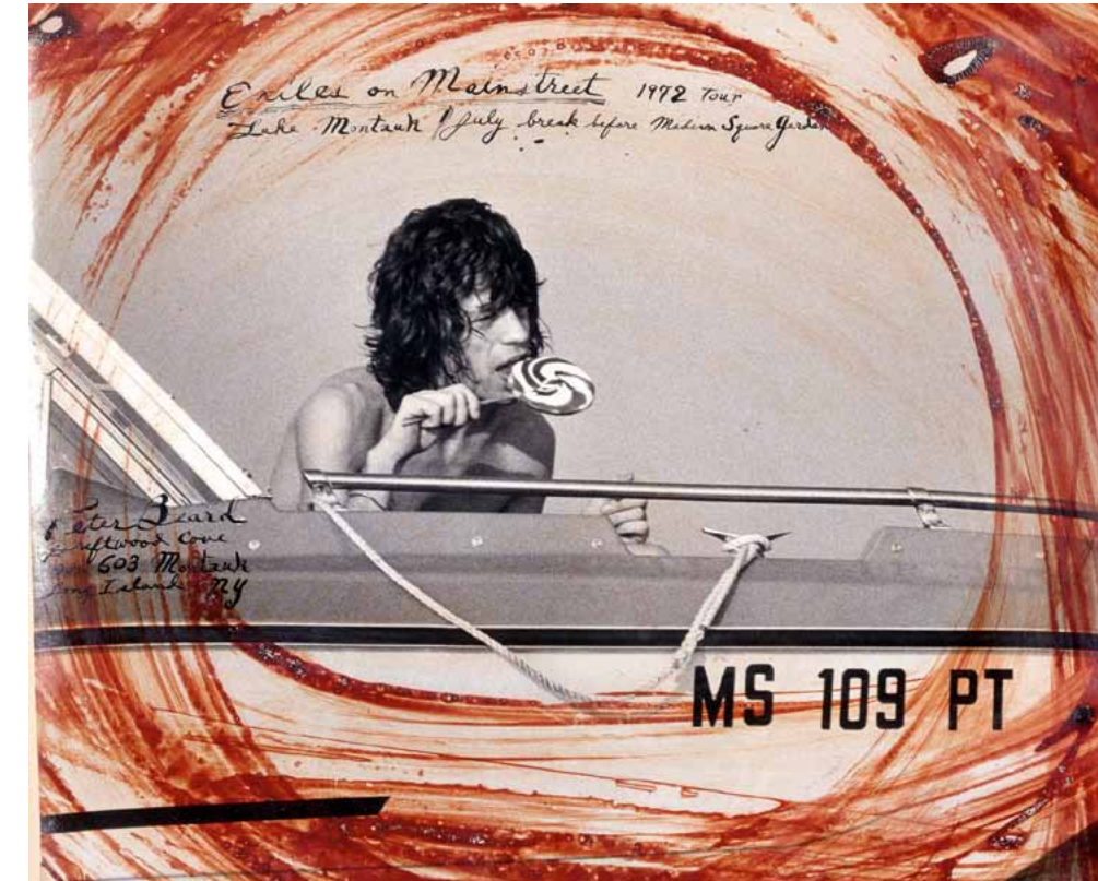
MONTAUK, USA, 1972. På 1970-tallet oppholdt Beard seg mye i Montauk, New York. Hans nærmeste nabo het Andy Warhol, Jackie Onassis fikk privattimer i fotografi, og ovennattsgjesten Mick Jagger (bildet) landet gjerne i privatfly.