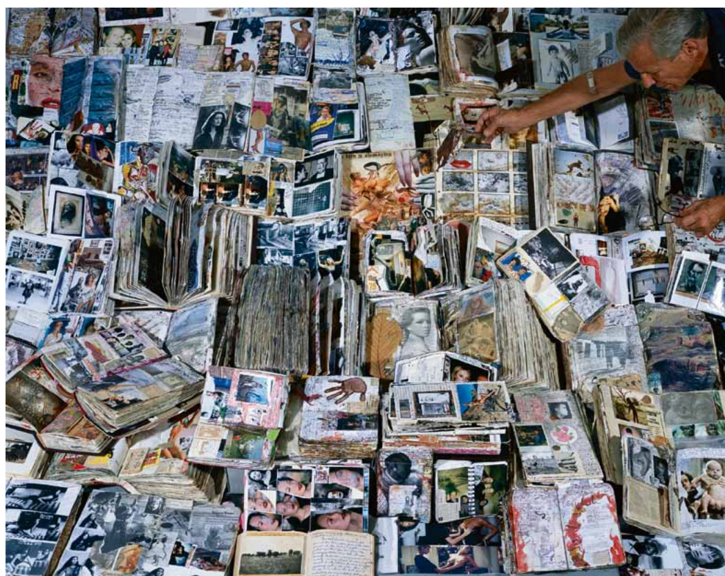
ALT I UORDEN. Peter Beard har laget tusenvis av dagbokcollager, men han vet ikke hvorfor. –Jeg liker å se haugen vokse hver gang året kommer til sin slutt, og de gjør seg best når de ligger klappet sammen, med sine frynsete kanter, stablet i endeløse, flytende tårn og rekker, sier han.