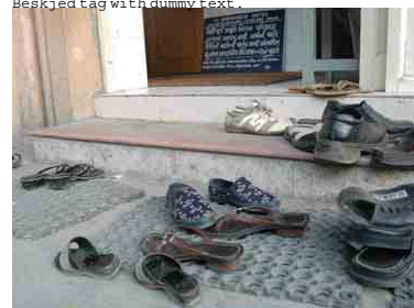
POPULÆRT: På to år er antallet fertilitetsklinikker tredoblet i India.

Renuka Chowdhury, minister for kvinner og barns utvikling i India