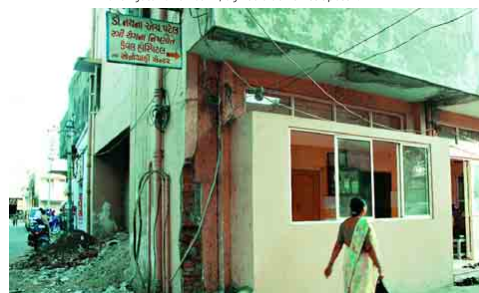
RUGEKASSE: Fruktbarhetsklinikken ligger rett over gata for en bank, og ved siden av et apotek.

- Den yngste datteren min på åtte var hjemme