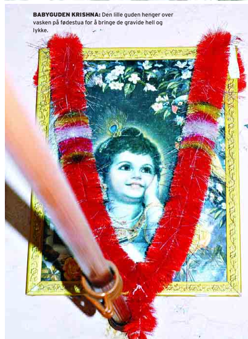
BABYGUDEN KRISHNA: Den lille guden henger over vasken på fødestua for å bringe de gravide hell og lykke.