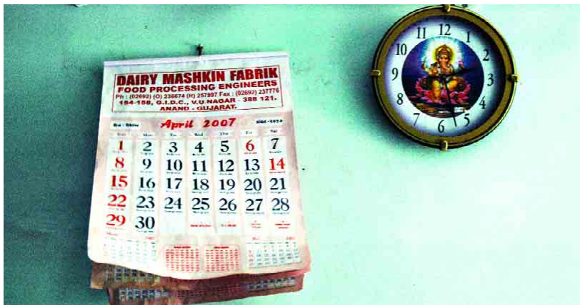
VEGGSPRYD: En kalender og en klokke med guden Ganesha, begynnelsens gud, er blant de få tingene lyser opp på veggene i fruktbarhetsklinikken i Anand.