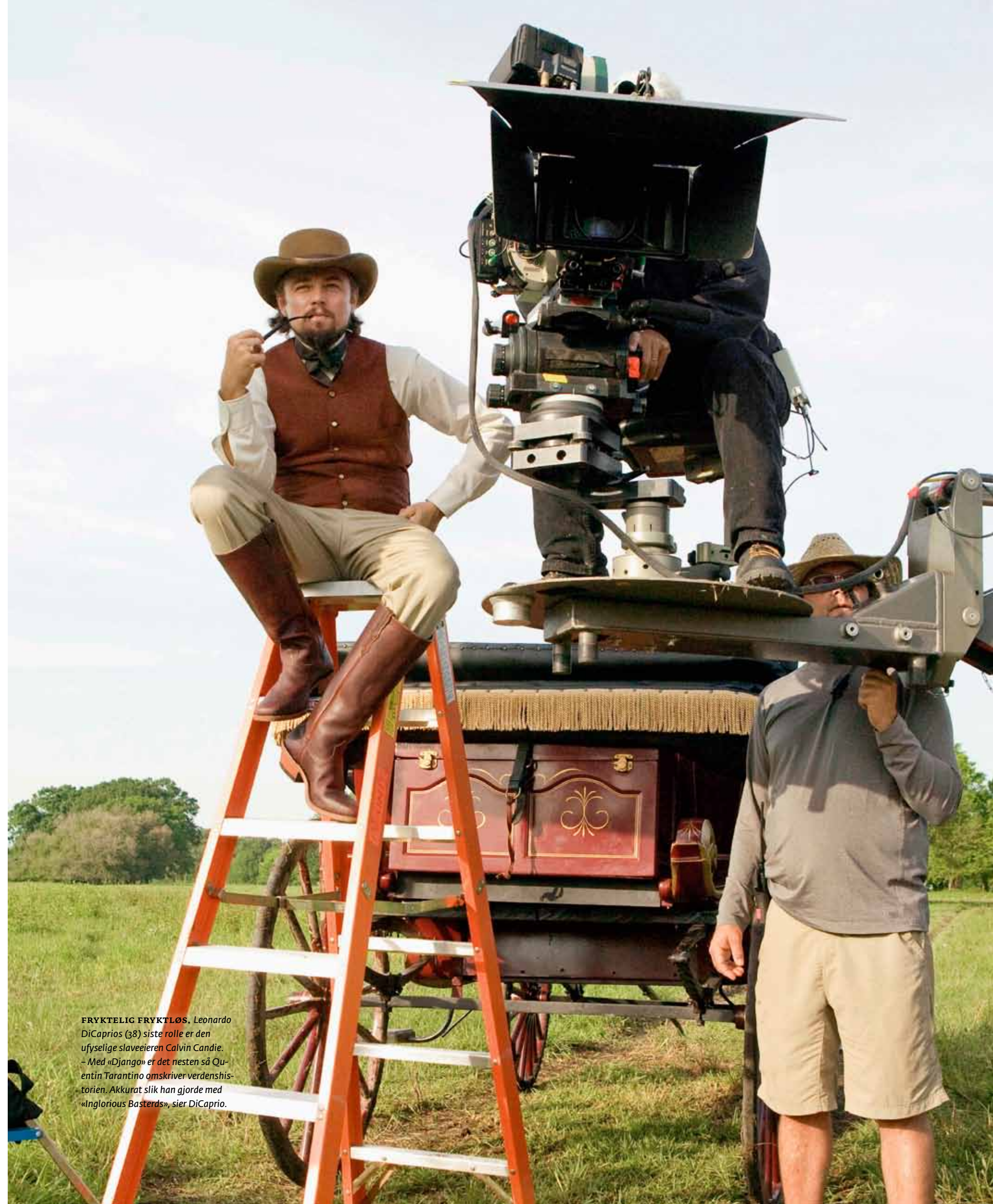
FRYKTELIG FRYKTLOS. Leonardo DiCaprios (38) siste rolle er den ufysiske slaveeieren Calvin Candie. – Med «Django» er det nesten så Quentin Tarantino omskriver verdenshistorien. Akkurat slik han gjorde med «Inglorious Basterds», sier DiCaprio.

Denne iboende selvfølgheligheten har gjort at DiCaprio nå har kjøpt en øy i Belize, luksushus og »