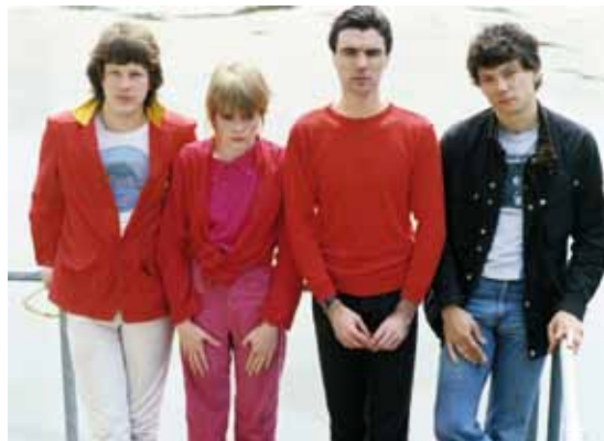
TALKING HEADS. Rockegruppen som ikke ville være en rockegruppe avbildet i Nederland i 1977. Fra venstre: Chris Frantz, Tina Weymouth, David Byrne og Jerry Harrison.

DEN VIKTIGSTE REGELEN. Allerede som barn var skotskfødte David Byrne annerledes. En gutt på grensen til Aspergers syndrom, har han selv sagt. I ungdomsskolekoret fikk han ikke stå lenge i rekkene, fordi læreren mente han virket tonedøv og bortkommen. Likevel lærte Byrne å spille både trekkspill og fiolin allerede før han fylte ti, men da tiden kom for å velge studieretning, valgte han kunsthøyskoler. Før han hoppet av, og startet det kortlevede bandet The Artistics sammen med medstudent Chris Frantz. Den kommende trommeslageren i Talking Heads flyttet til New York i 1974 sammen med Byrne og kjæresten