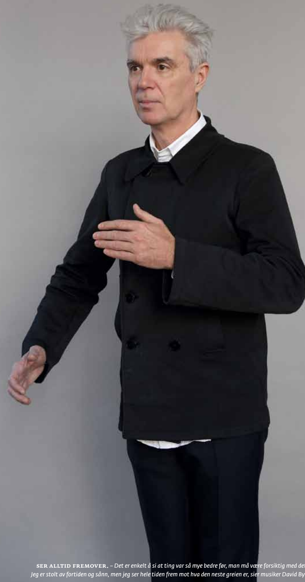
SER ALLTID FREMOVER. – Det er enkelt å si at ting var så mye bedre før, man må være forsiktig med det. Jeg er stolt av fortiden og sånn, men jeg ser hele tiden frem mot hva den neste greien er, sier musiker David Byrne.

– Da jeg ble klar over at flere folk hørte på, ble tilværelsen vår mer som et samfunn, et kollektiv. Vi mistet oss selv i denne store gruppen mennesker som plutselig så på oss, og tok vare på oss. Det var en deilig følelse. »